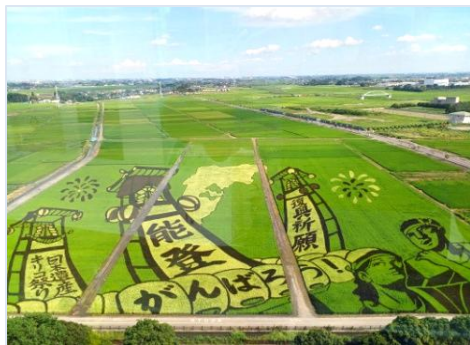
能登の復興祈願「田んぼアート」(N)

この新法は、センターの請負・委任事業者に適用され、従来のセンターと発注者との契約関係ではなく、会員と発注者の契約となり、センターは両者の橋渡しの役割を担うというものです。形としては会員・発注者・センターとの三者による包括契約となり